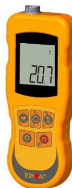
Рисунок 15 – Общий вид термометров контактных цифровых ТК-5 модификации ТК-5.06C