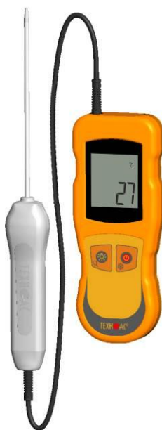
Рисунок 5 – Общий вид термометров контактных цифровых ТК-5 модификации ТК-5.01С