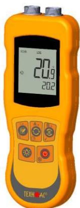
Рисунок 17 – Общий вид термометров контактных цифровых ТК-5 модификации ТК-5.11C