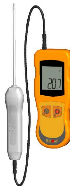
Рисунок 8 – Общий вид термометров контактных цифровых ТК-5 модификации ТК-5.01МС