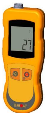
Рисунок 14 – Общий вид термометров контактных цифровых ТК-5 модификации ТК-5.04C