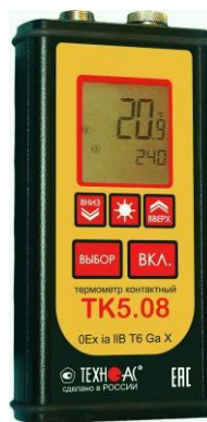
Рисунок 11 – Общий вид термометров контактных цифровых ТК-5 модификации ТК-5.08