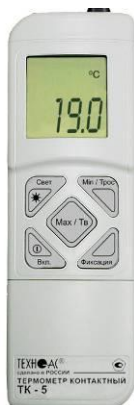
Рисунок 10 – Общий вид термометров контактных цифровых ТК-5 модификации ТК-5.06