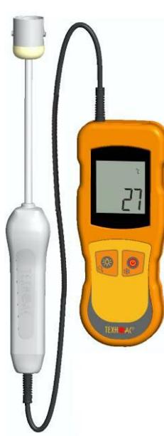
Рисунок 6 – Общий вид термометров контактных цифровых ТК-5 модификации ТК-5.01ПС