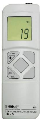
Рисунок 9 – Общий вид термометров контактных цифровых ТК-5 модификации ТК-5.04