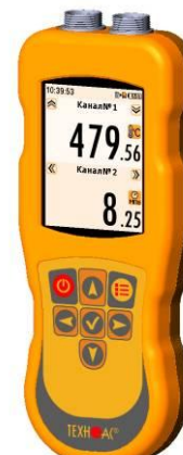
Рисунок 19 – Общий вид термометров контактных цифровых ТК-5 модификации ТК-5.29