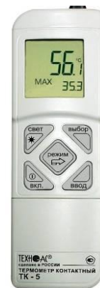
Рисунок 12 – Общий вид термометров контактных цифровых ТК-5 модификации ТК-5.09