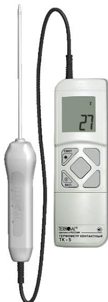
Рисунок 1 – Общий вид термометров контактных цифровых ТК-5 модификации ТК-5.01