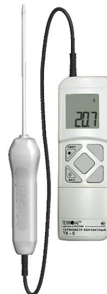
Рисунок 4 – Общий вид термометров контактных цифровых ТК-5 модификации ТК-5.01М