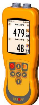
Рисунок 18 – Общий вид термометров контактных цифровых ТК-5 модификации ТК-5.27