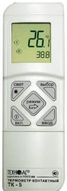
Рисунок 13 – Общий вид термометров контактных цифровых ТК-5 модификации ТК-5.11