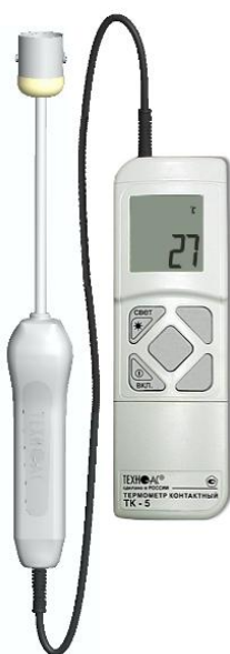
Рисунок 2 – Общий вид термометров контактных цифровых ТК-5 модификации ТК-5.01П