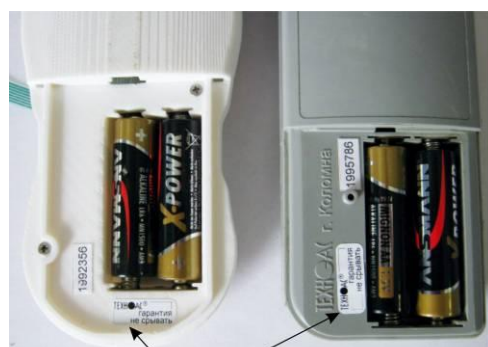
Место установки наклейки «Гарантия»: на винт, закрепляющий крышку с корпусом

Схема пломбировки термометров от несанкционированного доступа приведена на рисунке 43.