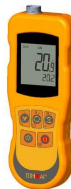
Рисунок 16 – Общий вид термометров контактных цифровых ТК-5 модификации ТК-5.09C