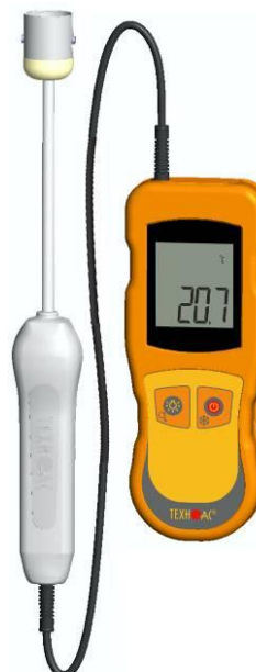
Рисунок 7 – Общий вид термометров контактных цифровых ТК-5 модификации ТК-5.01ПТС