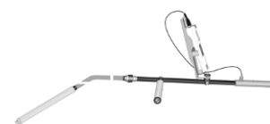
Рисунок 23 – Общий вид зондов погружаемых высокотемпературных (ЗПГВ)