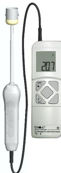
Рисунок 3 – Общий вид термометров контактных цифровых ТК-5 модификации ТК-5.01ПТ